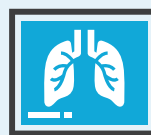
COPD (Enfermedad Pulmonar Obstructiva Crónica)