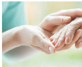
MAYAGÜEZ MEDICAL CENTER