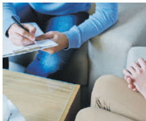
MANATÍ MEDICAL CENTER